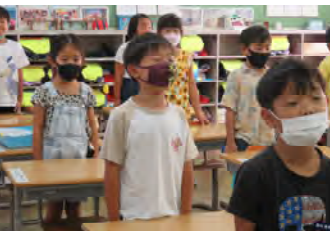
起立、礼も姿勢を正して