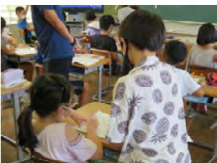
割り算、がんばってます