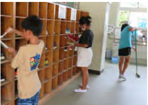
いろいろなところをピカピカに